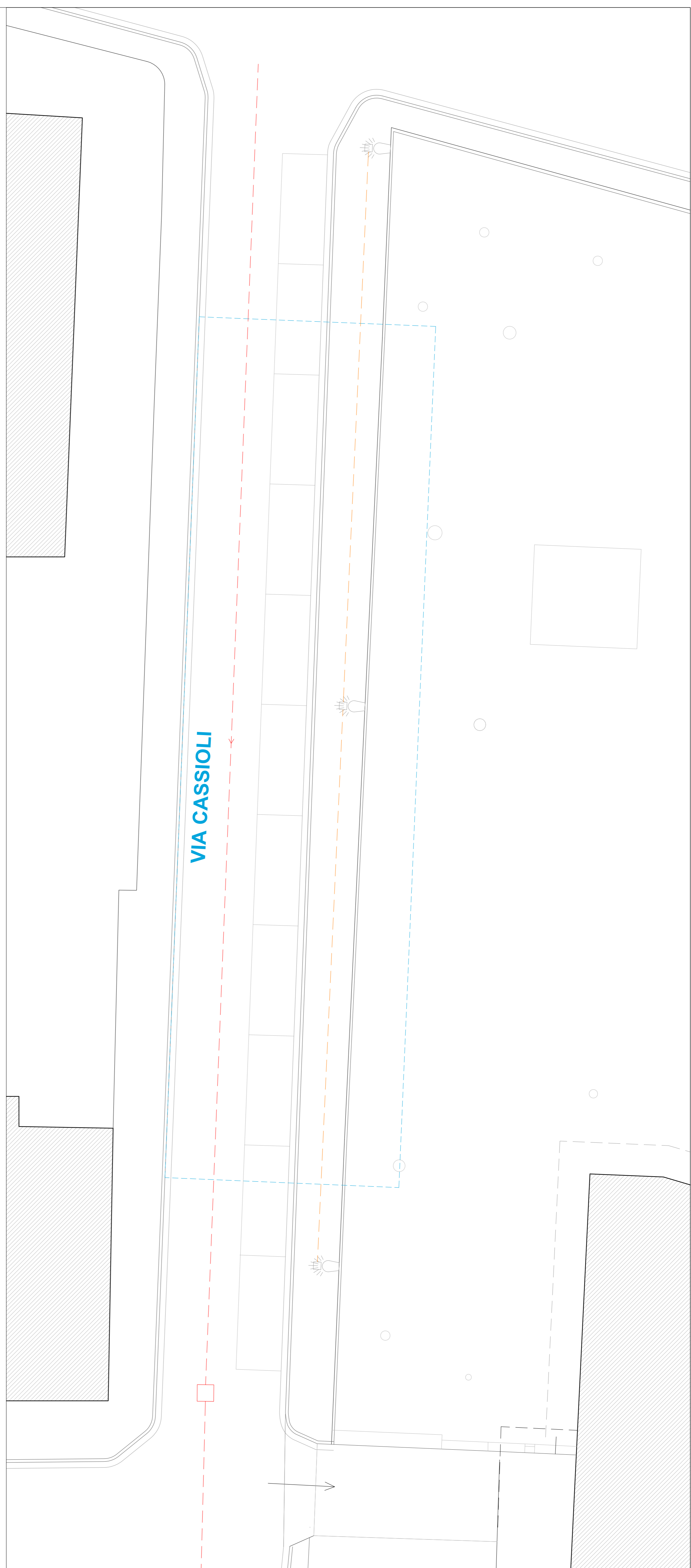
parcheggi via Cassioli | scala 1:100