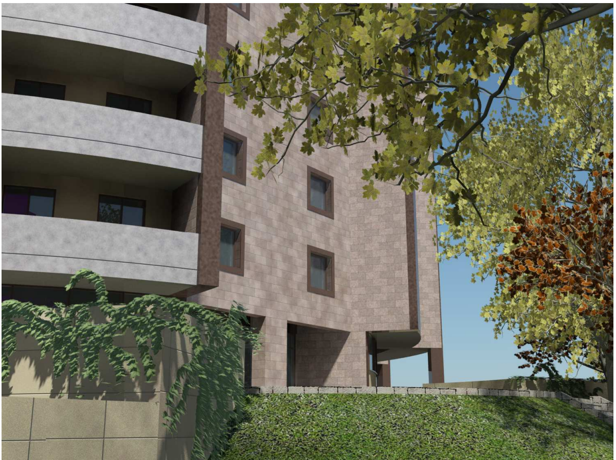
Vista n. 09