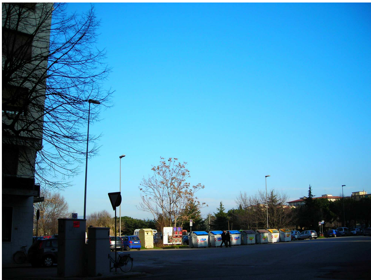
Vista n.03 stato attuale