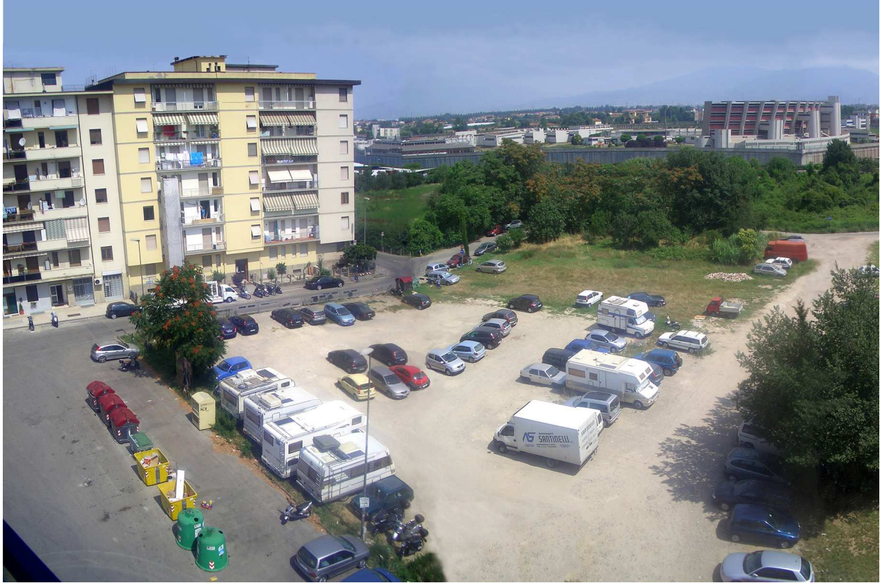
Vista n.07 stato attuale