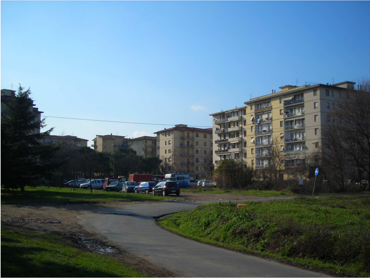
Vista n.06 stato attuale