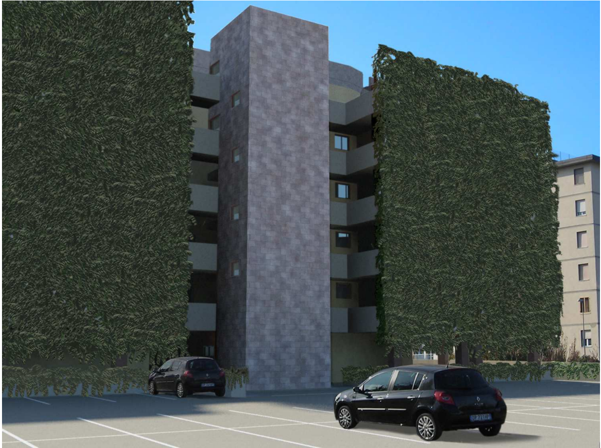
Vista n. 10