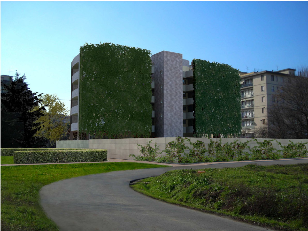
Vista n. 06 stato di progetto