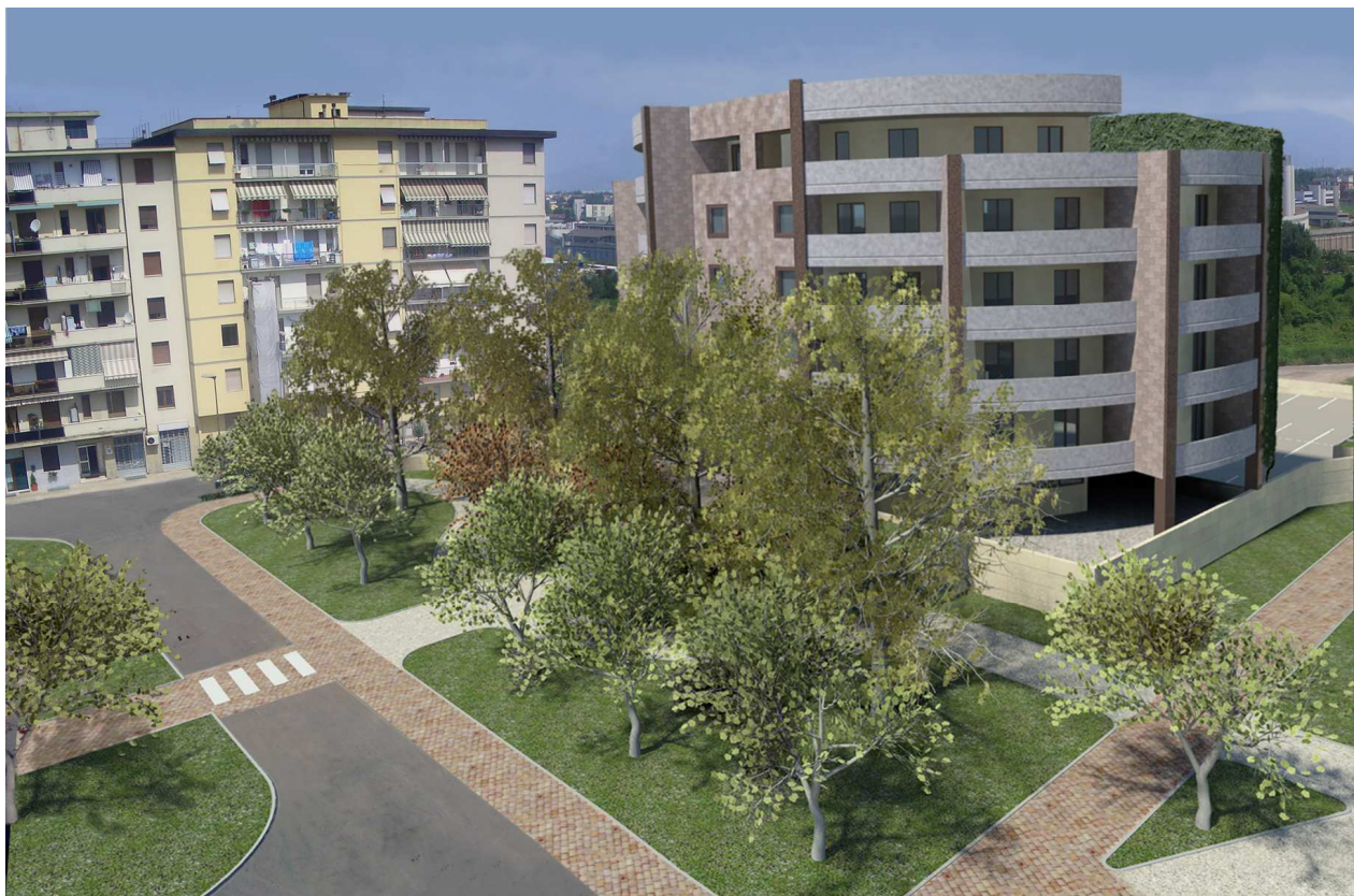
Vista n. 07 stato di progetto