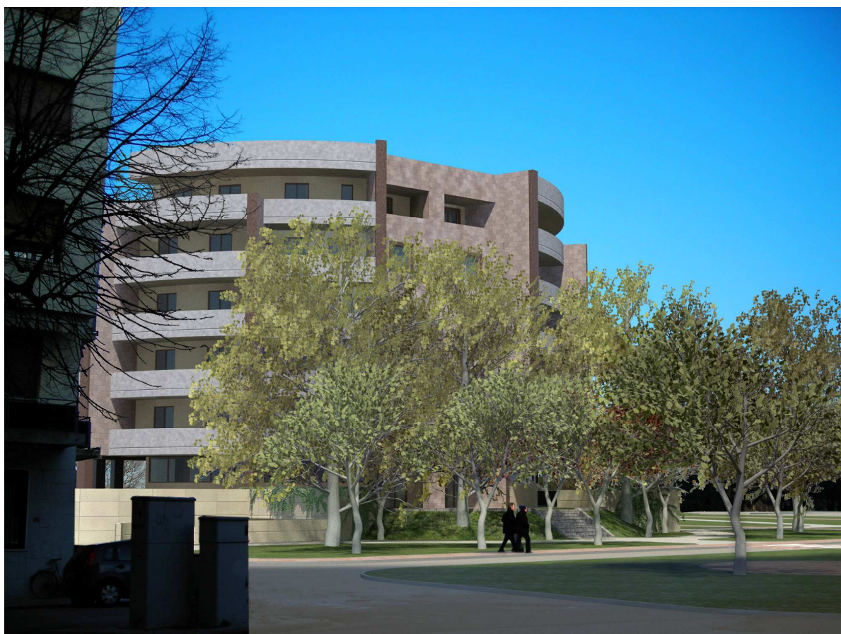
Vista n. 03 stato di progetto