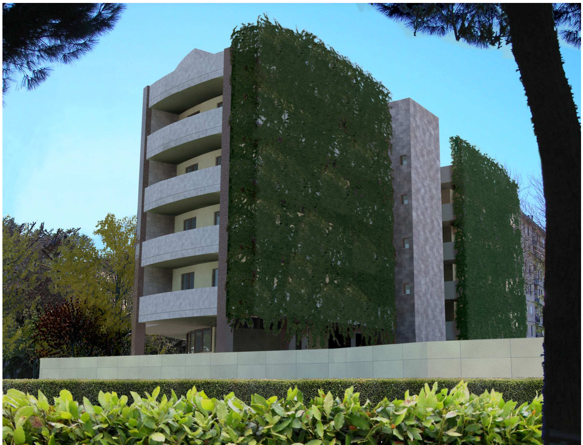
Vista n. 05