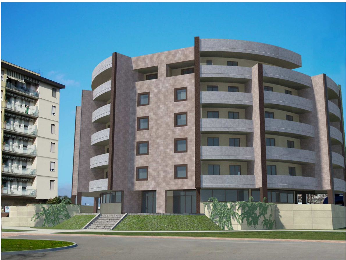
Immagine priva di vegetazione per facilitare la lettura dell'impianto architettonico