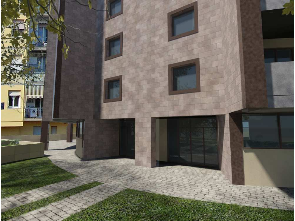
Vista n. 08