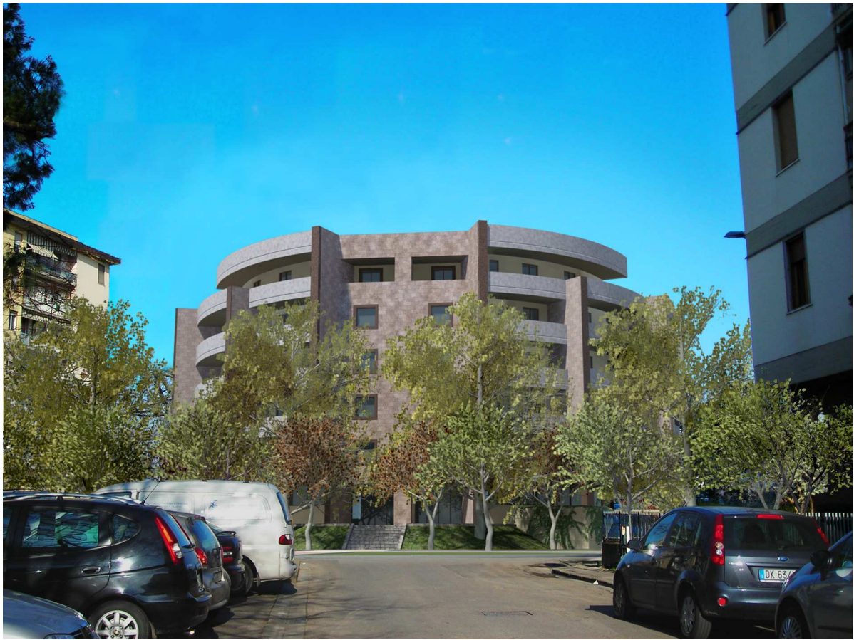
Vista n. 01