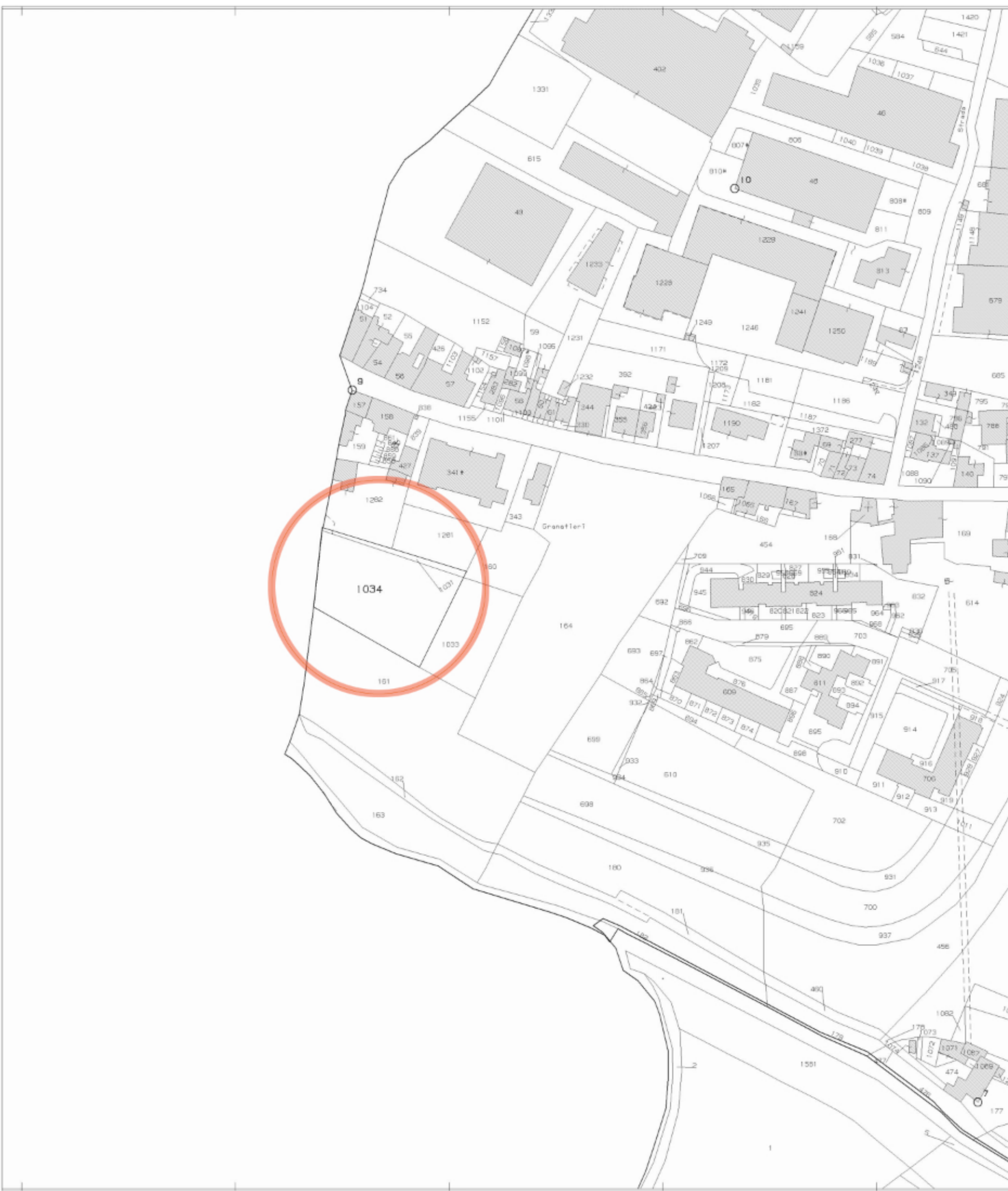
ESTRATTO DI MAPPA CATASTALE 1/2000