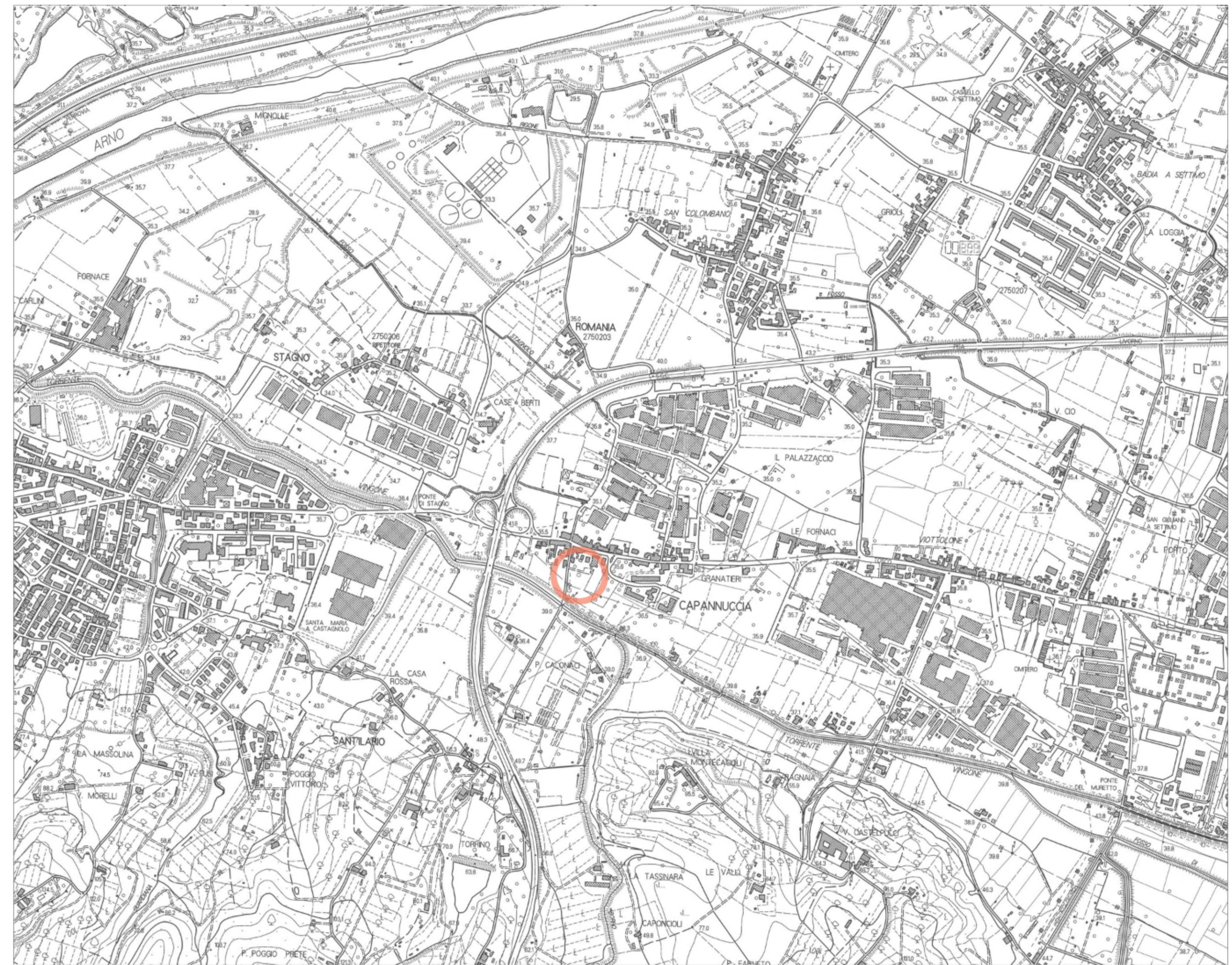
ESTRATTO CTR 1/5000