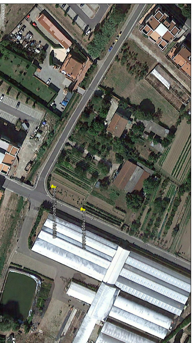
Tavola di inquadramento generale delle opere di urbanizzazione come da scheda R.U.C. RQ 08c SCALA 1:5000 NOVEMBRE 2017

TAVOLA : 16 Schema indicativo delle opere di urbanizzazione