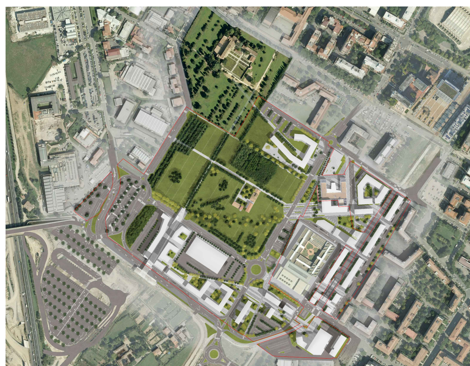
Masterplan Piano Particolareggiato TR 04c Gennaio 2020