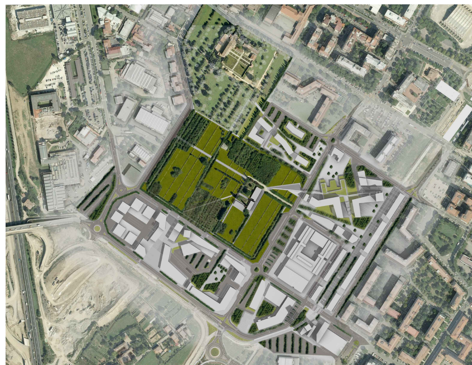
Masterplan Piano Particolareggiato TR 04c Febbraio 2010