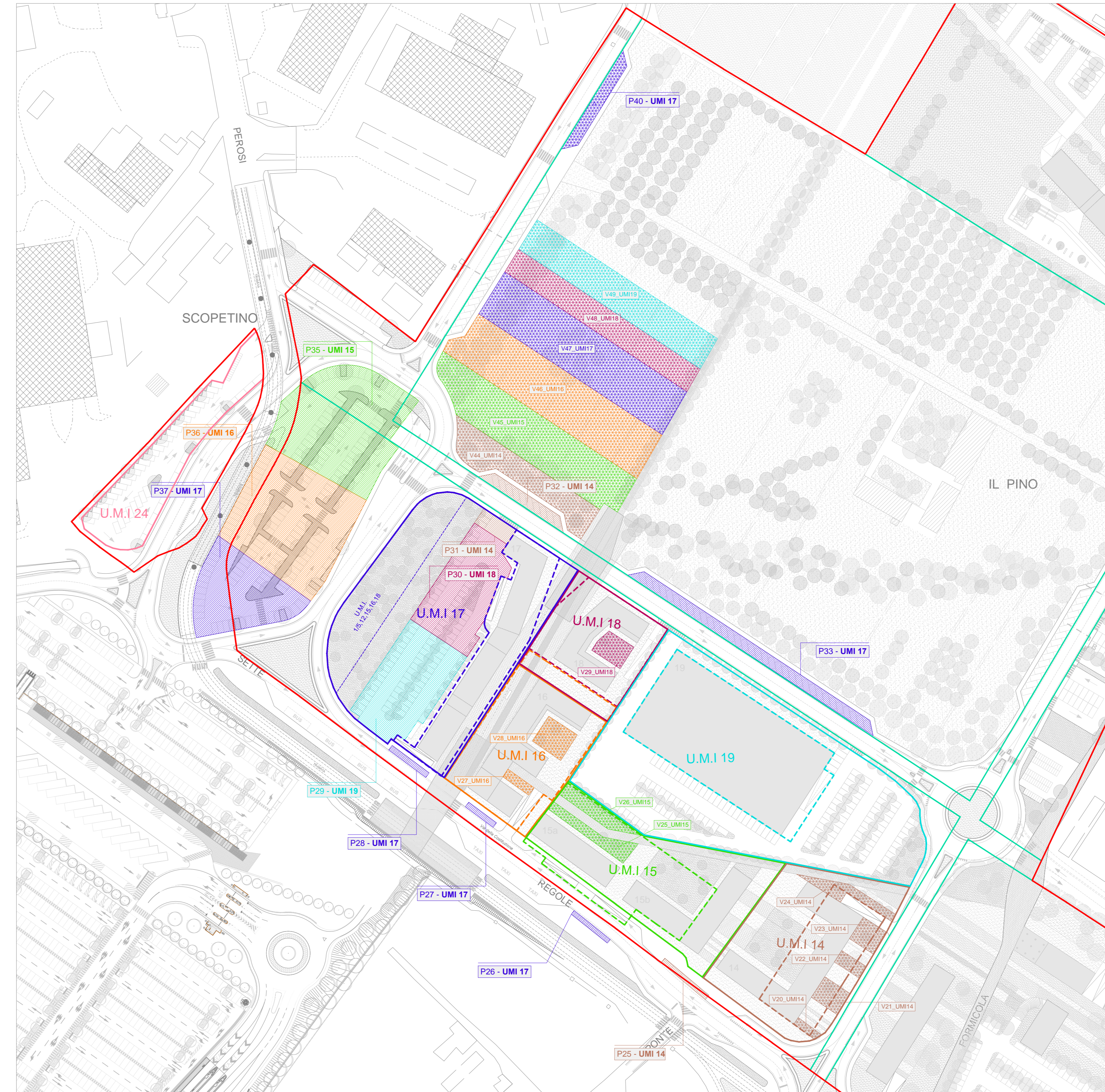
Individuazione delle urbanizzazioni correlate alle Unità Minime di Intervento